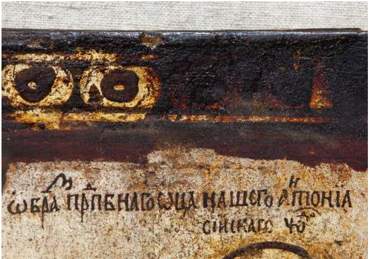
Фото 9. Икона с окладом "Образ Преподобного отца нашего Антония Сийского чудотворца» КП-16691/1 ДРЖ-653. В процессе реставрации, фрагмент. Надпись на фоне.