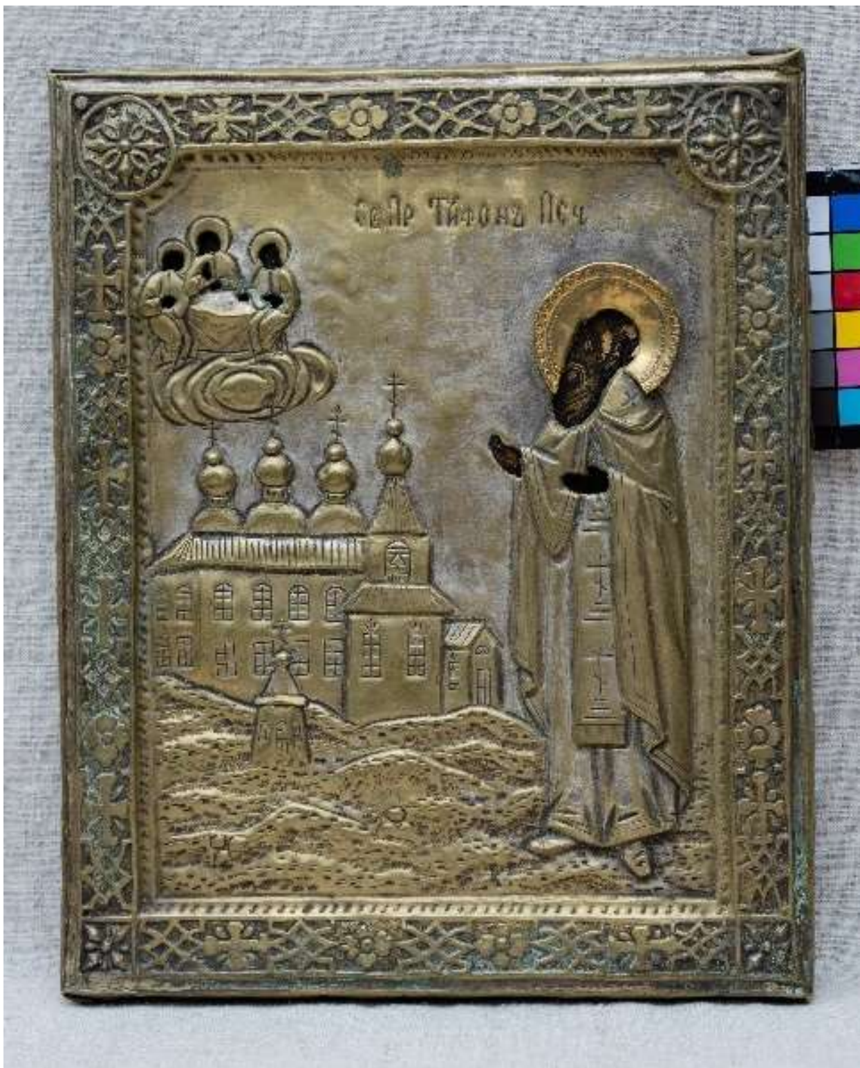
Фото 1. Икона с окладом "Образ Преподобного отца нашего Антония Сийского чудотворца» КП-16691/1 ДРЖ-653. До реставрации. Общий вид. Икона в окладе.