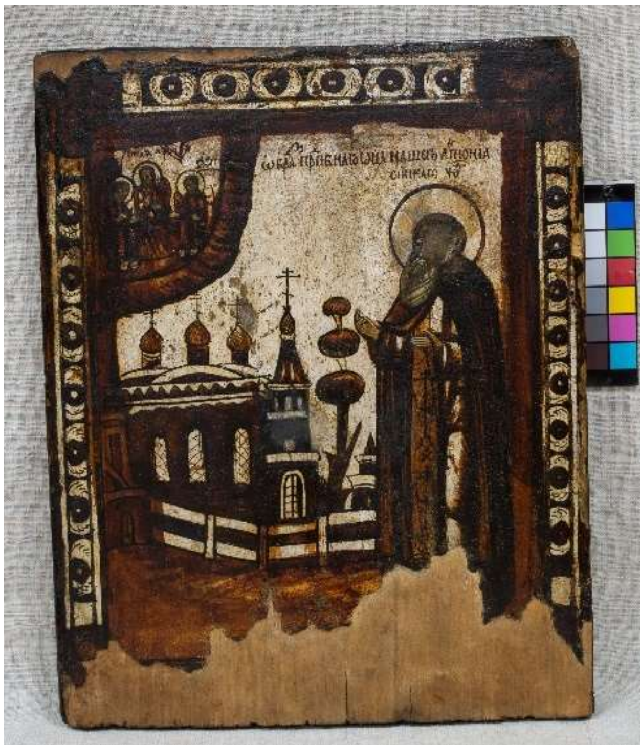
Фото 3. Икона с окладом "Образ Преподобного отца нашего Антония Сийского чудотворца» КП-16691/1 ДРЖ-653. После реставрации. Общий вид, лицевая сторона.