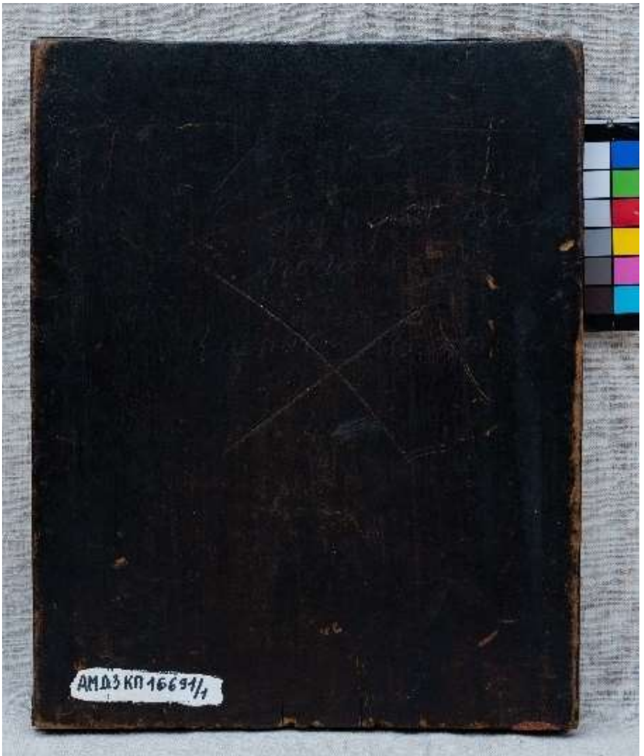
Фото 4. Икона с окладом "Образ Преподобного отца нашего Антония Сийского чудотворца» КП-16691/1 ДРЖ-653. Оборот, общий вид.