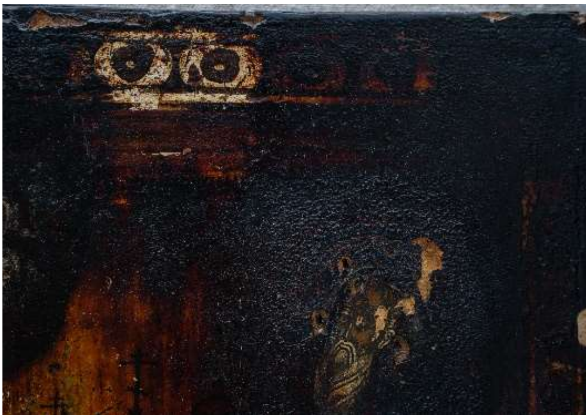
Фото 5. Икона с окладом "Образ Преподобного отца нашего Антония Сийского чудотворца» КП-16691/1 ДРЖ-653. До реставрации, фрагмент.