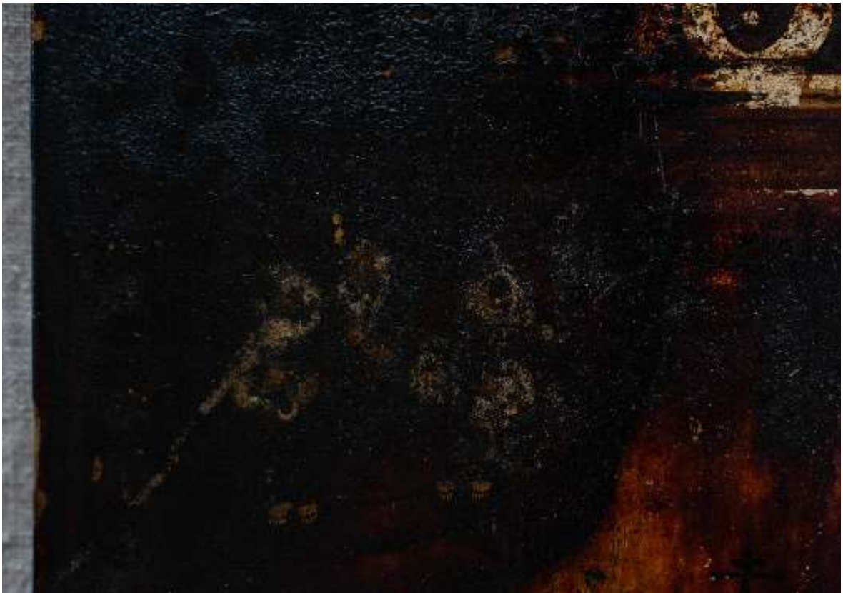
Фото 7. Икона с окладом "Образ Преподобного отца нашего Антония Сийского чудотворца» КП-16691/1 ДРЖ-653. До реставрации, фрагмент.