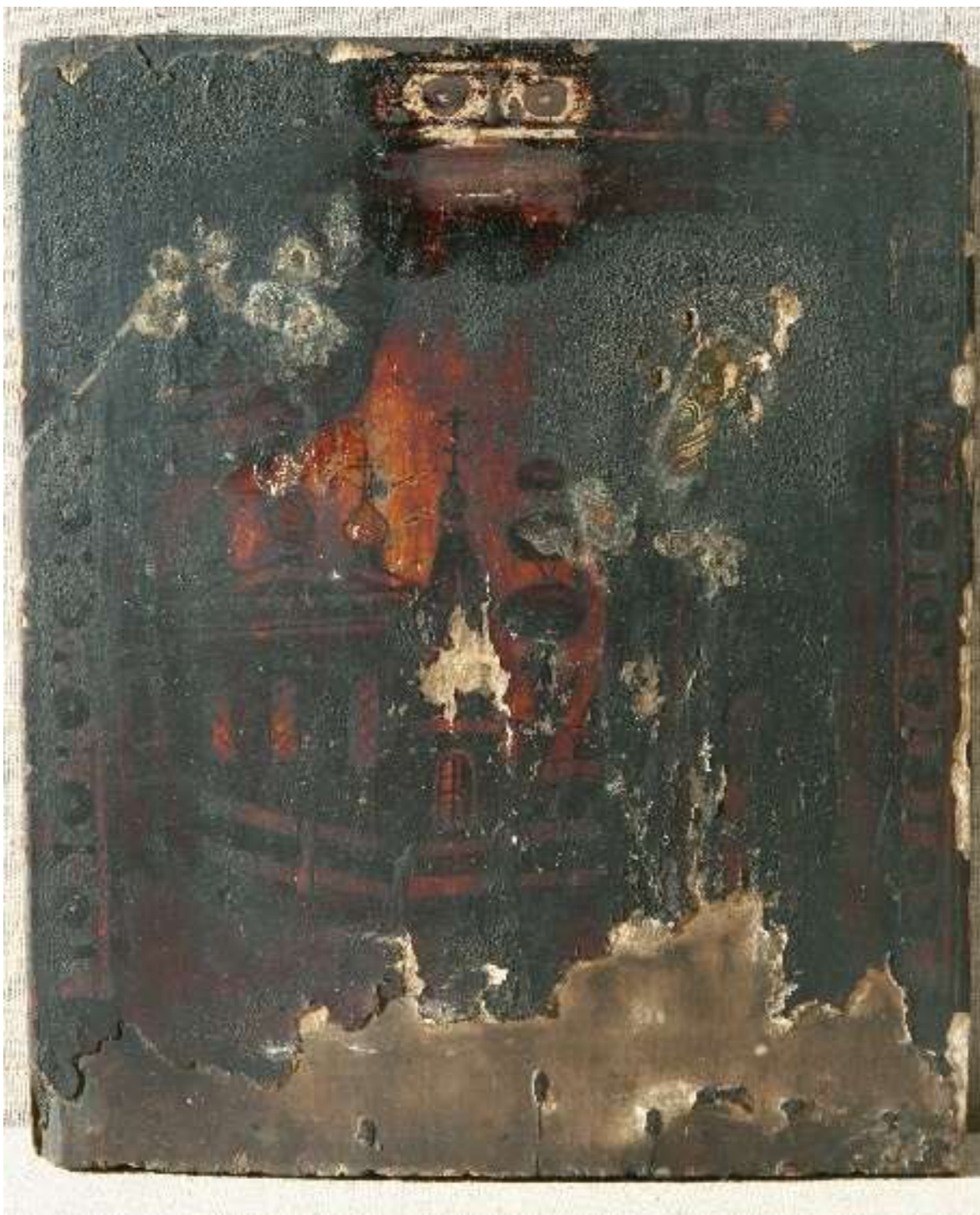
Фото 2. Икона с окладом "Образ Преподобного отца нашего Антония Сийского чудотворца» КП-16691/1 ДРЖ-653. До реставрации. Общий вид, лицевая сторона.