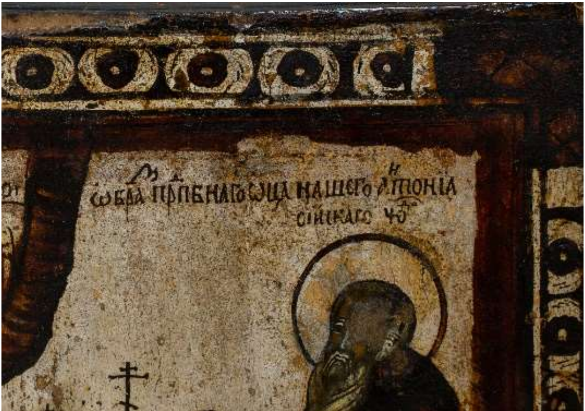
Фото 6. Икона с окладом "Образ Преподобного отца нашего Антония Сийского чудотворца» КП-16691/1 ДРЖ-653. После реставрации, фрагмент.