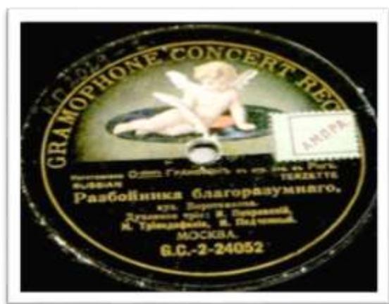
2. Пластинка граммофонная (этикетка). 1910 – 1914 гг. Акционерное общество с ограниченной ответственностью «Граммофон».

Основной торговой маркой компании «Граммофон» стала марка «Ангел» («Angel»). В России она получила название «Пишущий ангел», затем по требованию цензуры, была заменена на «Пишущий амур» (иллюстрация 2).