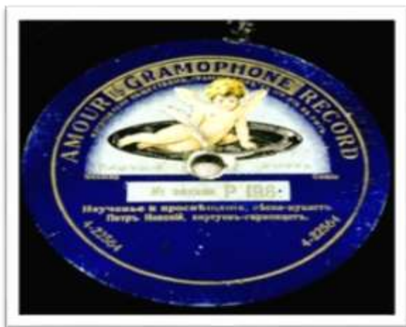
4. Пластинка граммофонная (этикетка). 1913 – 1914 гг. Акционерное общество с ограниченной ответственностью «Грамморфон». Фабрика: Российская империя, Лифляндская губерния, город Рига. КП-2029-34.

Изначально бумажные этикетки на пластинках были чёрного цвета. С 1913 года появляются пластинки с синими и зелёными этикетками («синий этикет», «зелёный этикет») 7 (иллюстрации 4, 5). Сегодня в коллекции музея находится 14 пластинок, выпущенных под маркой «Пишущий амур»: 4 односторонних и 10 двухсторонних (таблица 1).