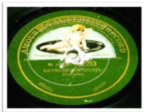
5. Пластинка граммофонная (этикетка). 1913 – 1914 гг. Акционерное общество с ограниченной ответственностью «Грамморфон». Фабрика: Российская империя, Лифляндская губерния, город Рига. КП-2029-2.

Вторая из распространённых в России марка пластинок компании «Грамморфон» - «Zonophone» появилась в 1903 году. Тогда компания «Грамморфон» выкупила фабрику в Риге у компании «International Zonophone Company», фактически поглотив конкурента. Марка «Zonophone» представляет собой слияние