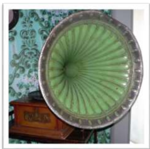
1. Граммофон. Первая треть XX в. Россия (?). КП-3633. М-2044.

Граммофон состоит из корпуса с пружинным двигателем, мембранного звукоснимателя с иглой, трубчатого тонарма, поддерживающего звукосниматель и растраба для усиления звука (иллюстрация 1). Штамповка граммофонных пластинок осуществлялась с помощью специальных гидравлических прессов из горячей пластической массы, основными компонентами которой были шеллак 2 , тяжёлый шпат, флат (мелко истёртая ткань) и сажа.