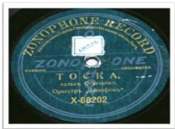
6. Пластинка граммофонная (этикетка). 1910 – 1914 гг. Акционерное общество с ограниченной ответственностью «Граммoфон». Фабрика: Российская империя, Лифляндская губерния, город Рига. КП-3795.

двух слов: «ZONOPHONE» написанных по вертикали и горизонтали, пересекающихся и образующих крест, обведённый прямыми линиями (иллюстрация 6). Эта марка использовалась исключительно для недорогой продукции, выпускающейся большими тиражами 8 . На текущий момент музей располагает 24 двухсторонними пластинками, выпущенными под маркой «Zonophone» (таблица 2).